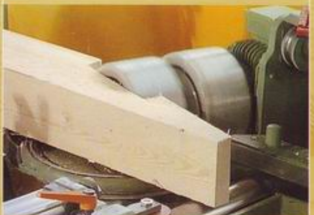
- Hakenblattfräsung -

Garantiert ausrissfreie Bearbeitungen durch Drehrichtungswechsel während der Bearbeitung.