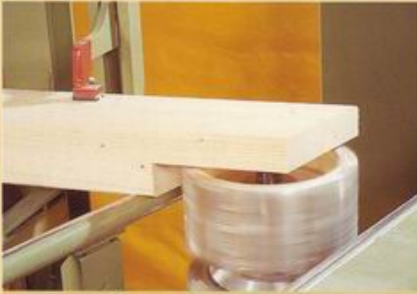
Überblattungs-Zapfenfräse - Firstblattfräsung -

Garantiert ausriffreie Bearbeitungen durch Drehrichtungswechsel während der Bearbeitung.