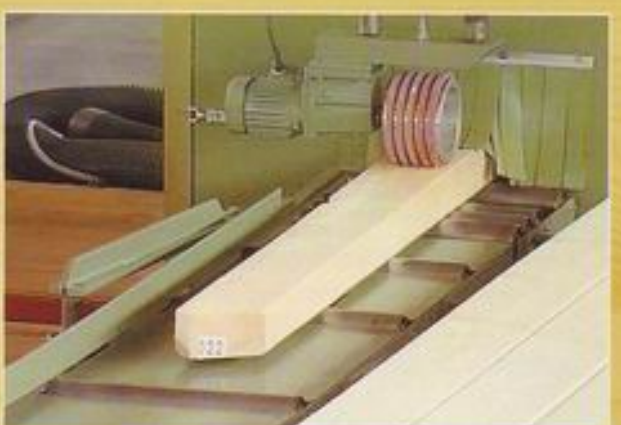
Hobelautomat - Sparrenkopf, gehobelt und gefast mit Bauteilnummer nach Abbundplan -