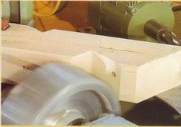
Vertikalfräse - Fräsung für innenliegende Dachrinne -

Garantiert ausriffreie Bearbeitungen durch Drehrichtungswechsel während der Bearbeitung.