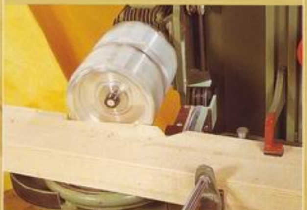
- Doppelversatzfräsung -