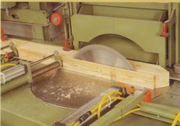
- Traufschalungsausschnitt -