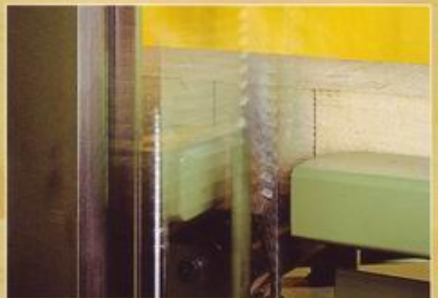
Markier- / Anreißgerät - Anreißen der Sparrenteilung -