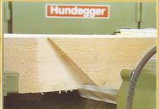
- Durchlaufkervenfräsung -