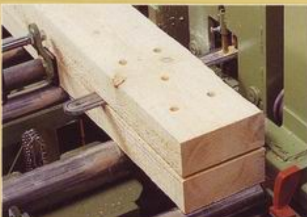
Kettenstemmer horizontal - Knotenblechschlitzung -