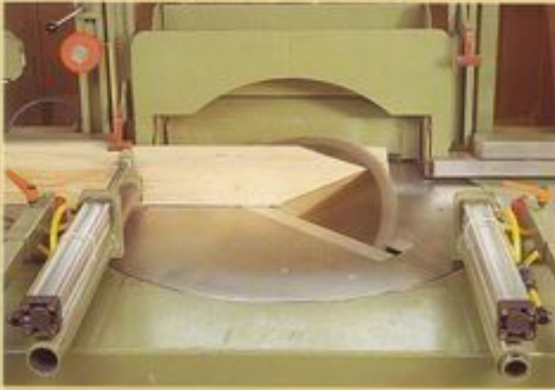
Hydraulische Untertischschwenkkappsäge - Schifterschnitt -