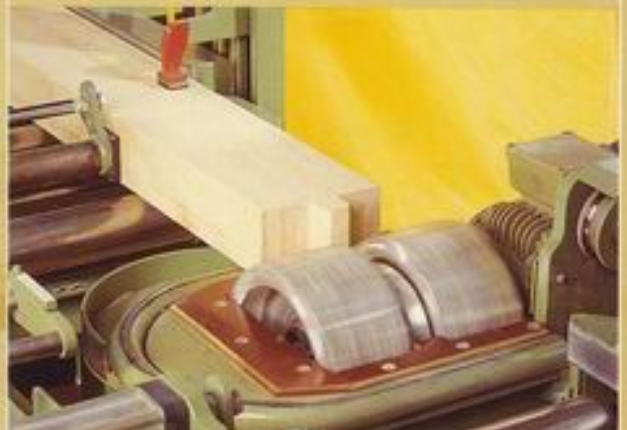
- Zapfenfräsung -