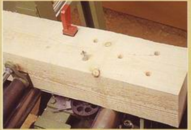
Vertikalbohrgerät - Stabdübelbohrungen -