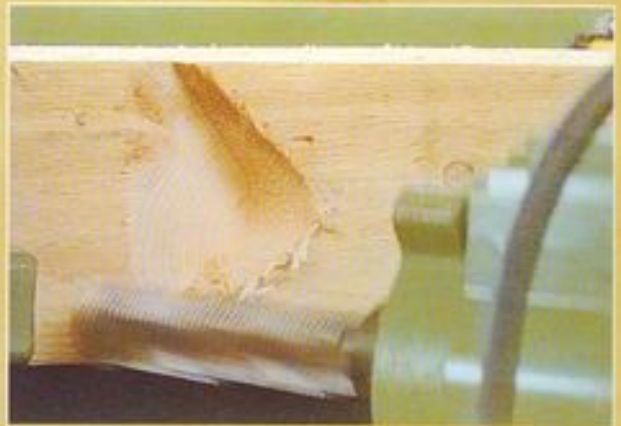
Fingerfräsaggregat - Gratsparrenkervenfräsung -