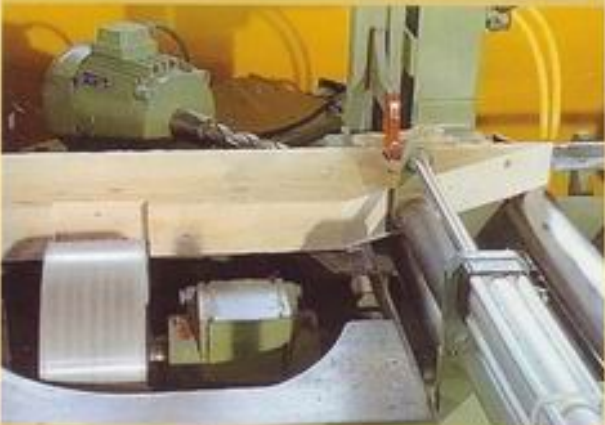
- Zangenausblattung -