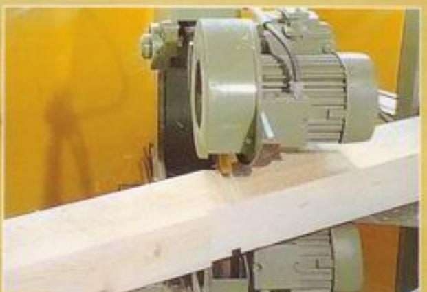
Stellbrettfräse - Stellbrettnutfräsung -