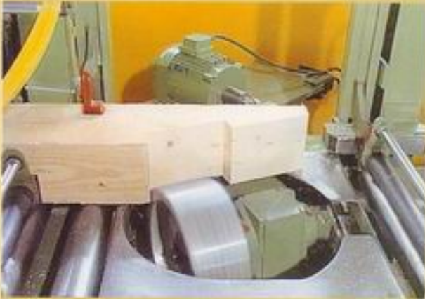
- Hakenblattfräsung -