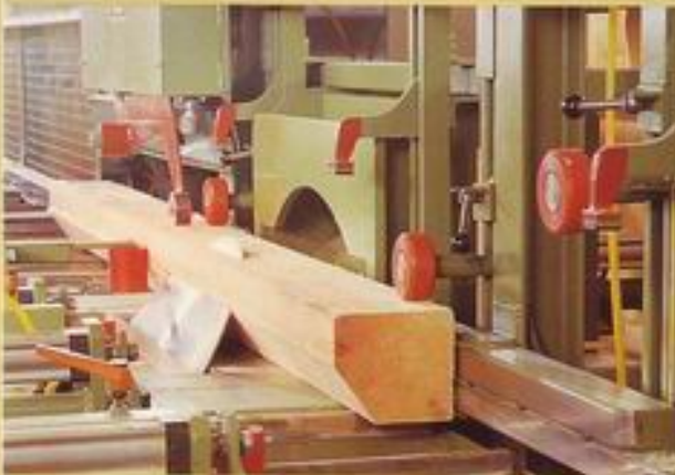
- Abgratung -