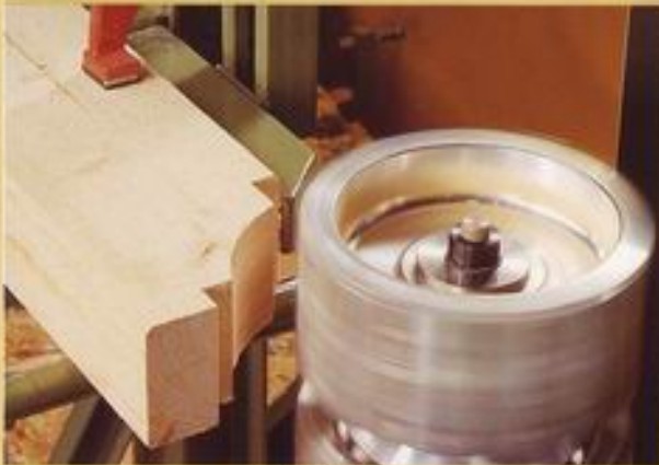
- Profilfräsung -