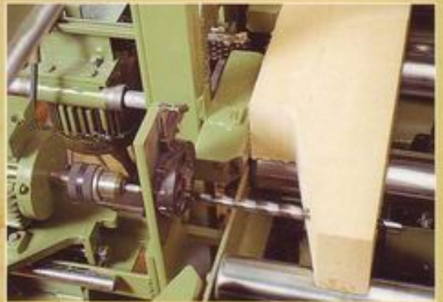
Horizontalbohrgerät - Gerberstoßbohrungen -