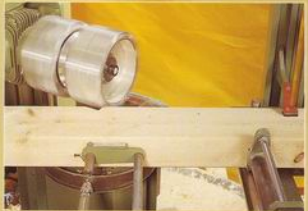
Kerven-Zapfenfräse / Sparrennagel-Bohrgerät - Kervenfräsung mit gleichzeitiger Nagelbohrung -