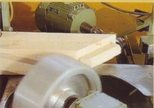
- Absetzen von Zapfen -